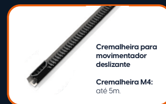
Cremalheira para movimentador deslizante